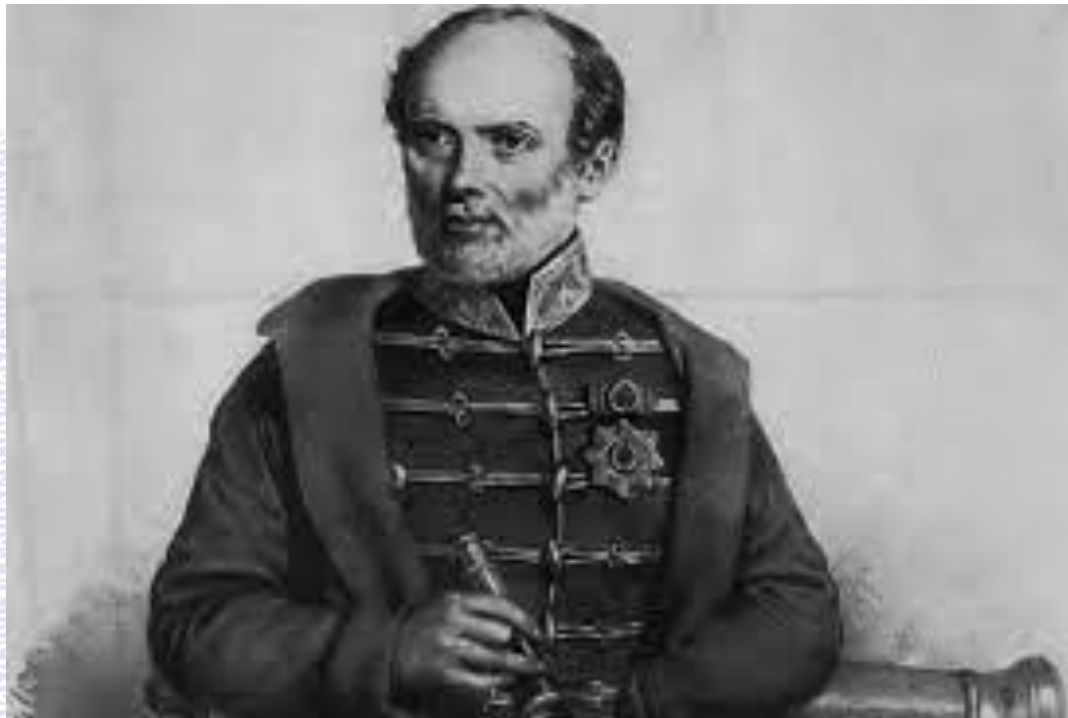
Generał inżynier Józef Z. Bem (1794-1850)