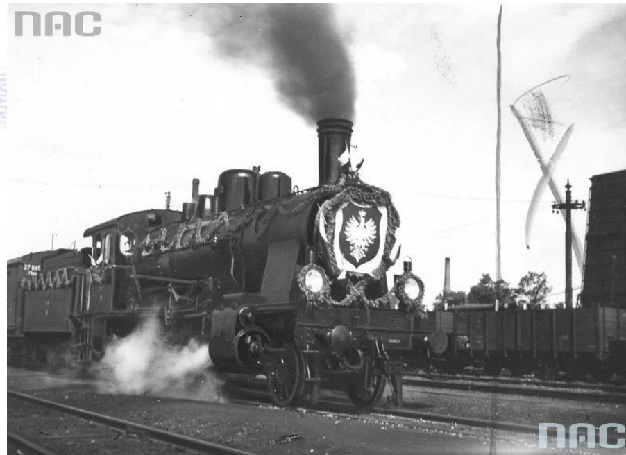
Narodowe Archiwum Cyfrowe, sygn. 1-P-3446-4

Generał inżynier Józef Z. Bem (1794-1850)