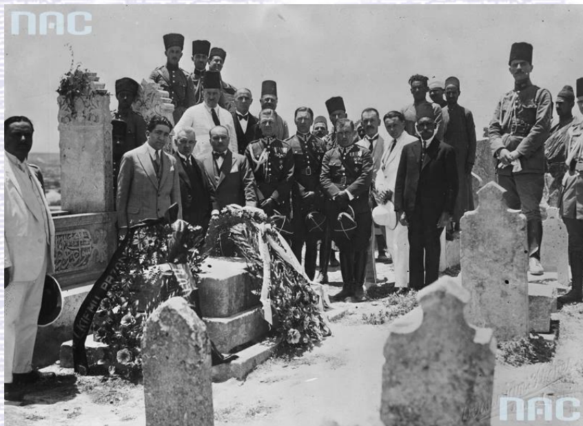
Narodowe Archiwum Cyfrowe, sygn. 1-P-3443-4