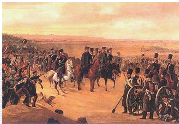
Generał inżynier Józef Z. Bem (1794-1850)