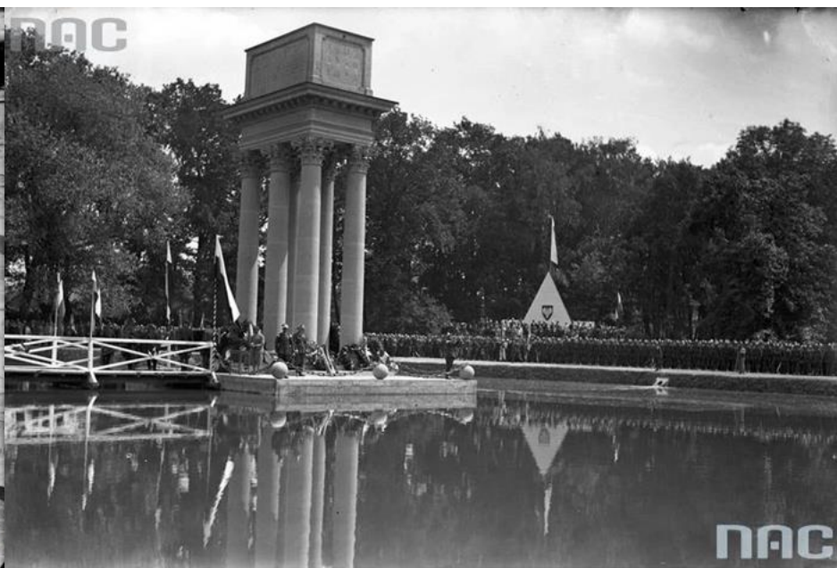
sygn. 1-P-3449-19

Generał inżynier Józef Z. Bem (1794-1850)