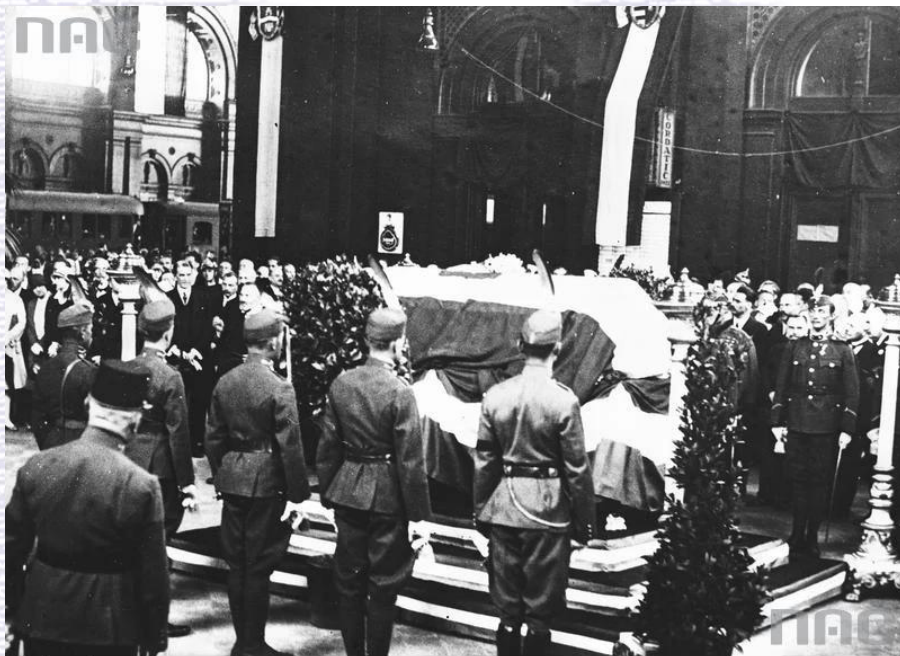
sygn. 1-P-3445-1