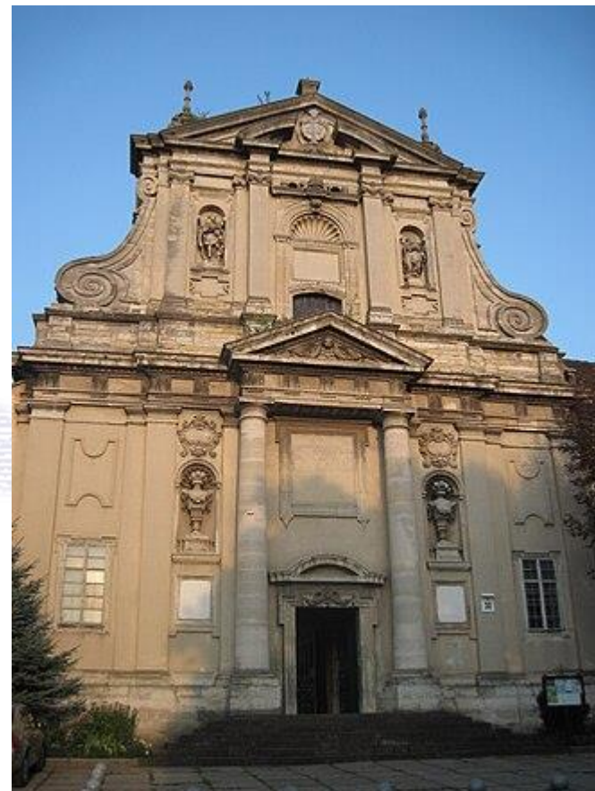
Kościół Matki Boskiej Gromniczej i klasztor Karmelitanek Trzewickowych we Lwowie